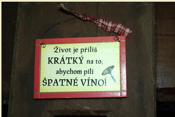
Rosťa chce, abychom měli MOTTO neustále na očích!

Návštěvní exkurze do Vrboveckého sklípku, spojená jednak s ochutnávkou a jednak konzumací jistého (více než malého množství) lahodného moku, se stala tradiční neoficiální a hlavně dlouho očekávanou akcí. Okamžik "O" nastal 15.10.2011 v 17:00 hod. LIČ.