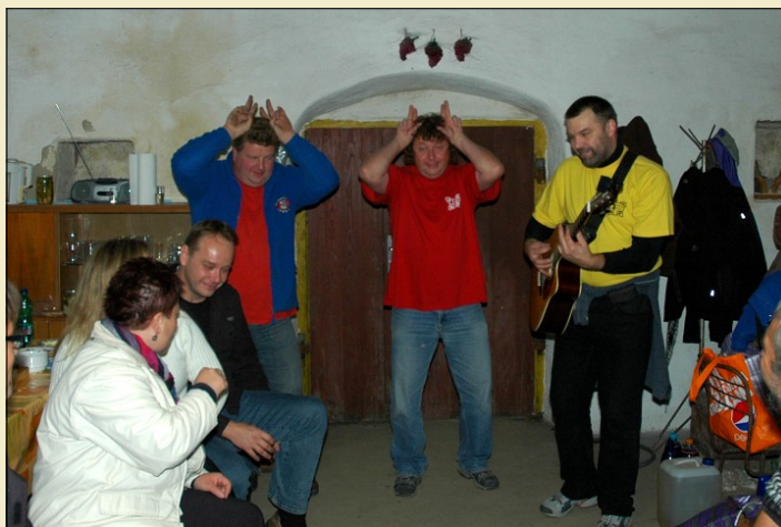
Králíci dupali o 106. . .