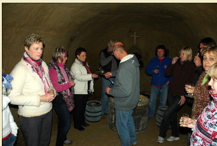
Ochutnávka je v plném proudu