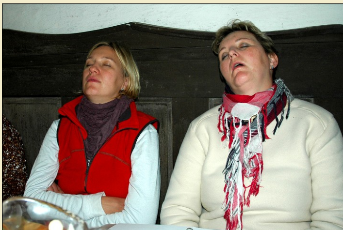
Sesterský duospánek. . .