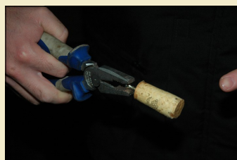
Archivní víno otevřel Tomáš kombinačkami s vrutem

Jako na drátkách se jali všichni, kdo přivezli něco na zub, připravovat své pamlsky. Oči jen přecházely při pohledu na ty hory jídla, které se na "stolečku prostříse" vršily. Všechno jídlo vypadalo stejně dobře, jako to nakonec chutnalo - boží zážitek. No pohledte na fotodokumentaci. Kromě úžasných klobásek a skvělého uzeneho se na stole objevily Jirkovy překvápkové rolády (kuřecí, vepřová a hovězí).