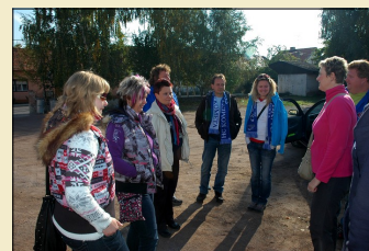
Tak nasedat a frčíme domů