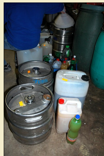
Studánka. . .

Tentokrát se čekačka dost protáhla. Jednak proto, že přešrl nádoby ne a ne být napl-