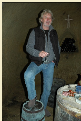
Captain Morgan?? Reklama na víno?