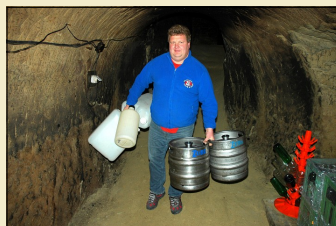
S prázdnými sudy to ještě šlo. . .